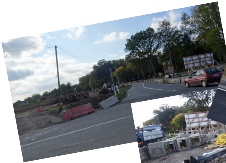
Travaux au Fort Rompu et ouverture du rond-point