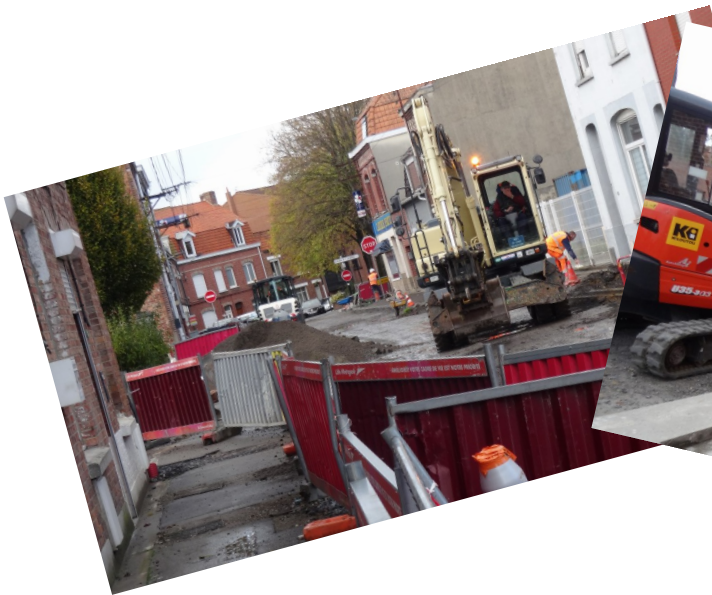
Venue des Allemands