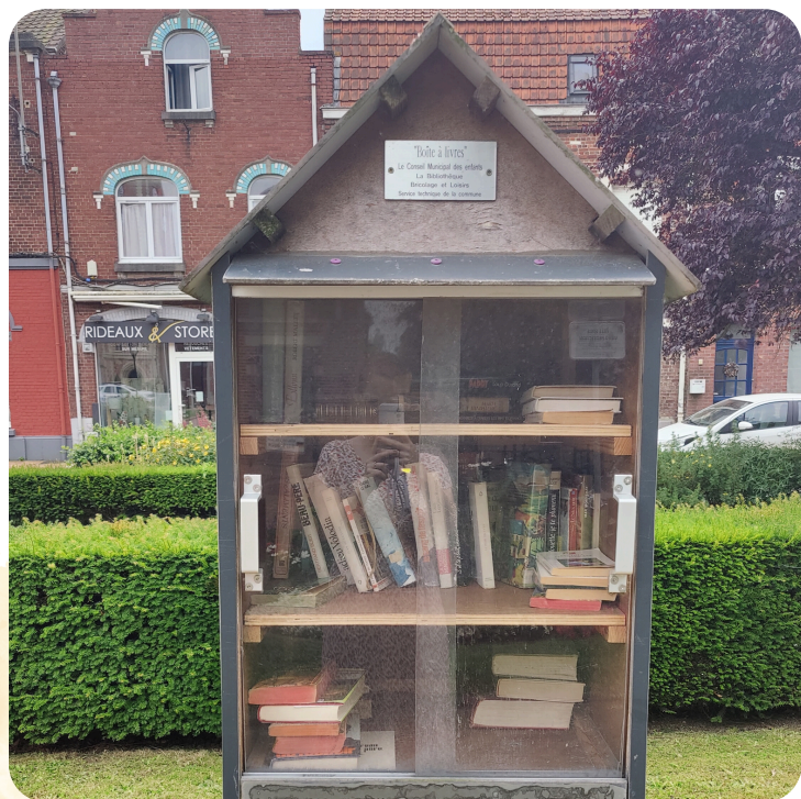
Exemple de la boîte à livres devant la mairie.

Nous sommes la commission "École, culture, loisirs". Nous avons mis en place un projet : une boîte à livres qui consiste à récupérer des livres usagés ou non-utilisés pour tout âge et de toute taille.