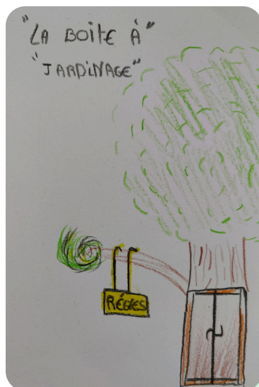
Croquis de la boîte.

On a réfléchi à sa forme et on a demandé au service technique de nous aider. Aussi, on a rédigé les règles de la boîte pour que tout le monde l'utilise correctement : on dépose ou on prend des choses qui servent au jardin (graines, pots, terreau, outils, etc...). On espère l'inaugurer à la rentrée.